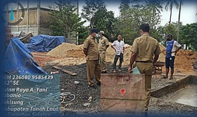
Cek Lapangan Permohonan IMB